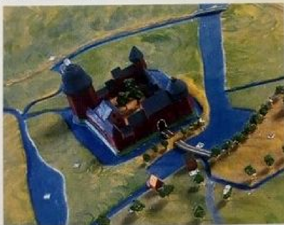
In 1628 bezorgde Heim Levi 28 keer vlees bij Kasteel Ulft. Maquette in 2015 gemaakt door Ziko van Dijk

In de Franse tijd, zo ca 1800, woonden er 58 joden in Gendringen en Ulft. (Dit getal wordt de rest van de 19 e eeuw niet