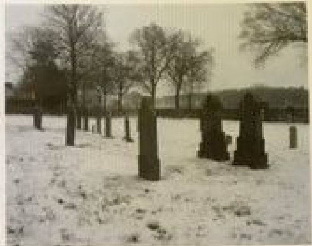
De begraafplaats aan de Uiftseweg in Gendringen