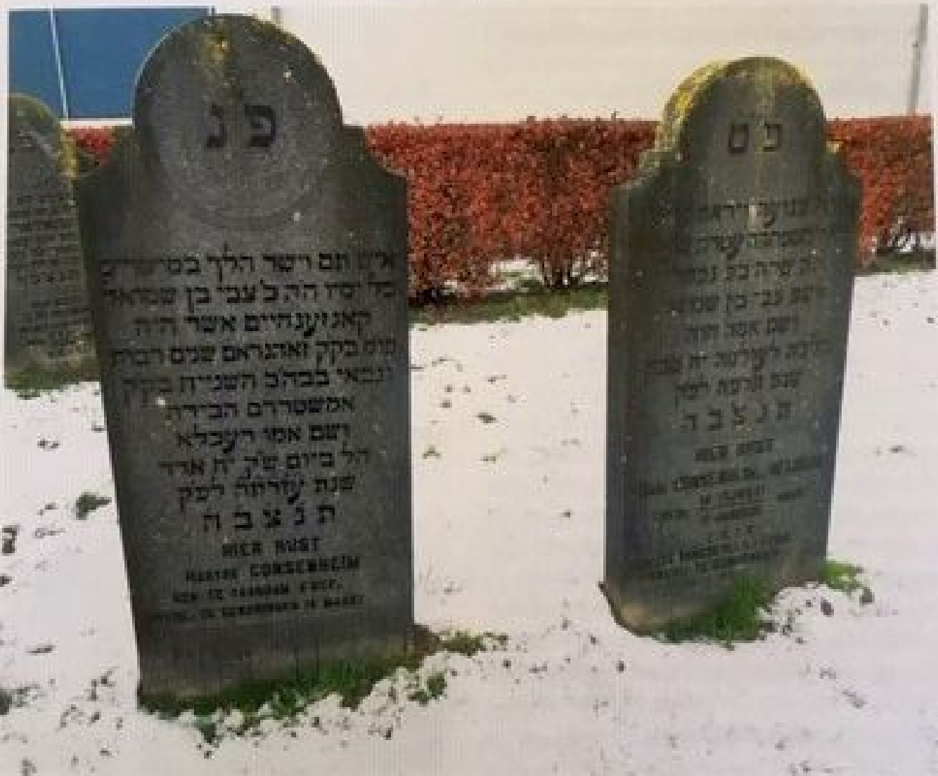
Soms staat er ook Nederlandse tekst op de stenen, zoals deze van Hartog Consenheim (†1848 †1922) en Sara Consenheim-Heijman (†1928).

die tijd een klein begraafplaatsje. 30 jaar later werden alle begraafplaatsen verplicht er een huisje op te bouwen hetgeen de kille direct deed.