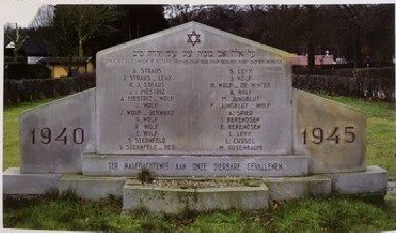
Het joods monument aan de Silvoldseweg in Terborg